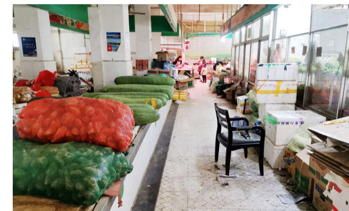
▲老旧农贸市场乱堆放现象依然普遍

农贸市场关乎老百姓的菜篮子,然而,由于经营者和投资者的原因,农贸市场较普遍存在硬件设施简陋、卫生状况不佳的问题。在今年市“两会”上,政协侨联界别提交了《关于进一步解决我市农贸市场难点问题的建议》,建议进一步提升硬件设施、改善市场环境。