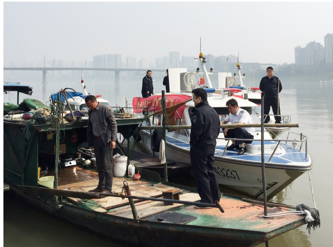
▲市渔政工作人员在进行摸底调查工作