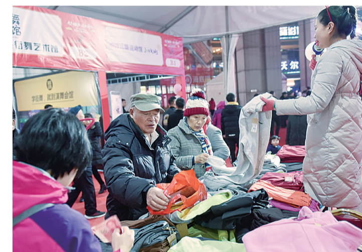
▲昨晚,首届夜间文化消费节开幕。图为市民在购买物品

本报讯(记者 肖蓉 通讯员 李茂春)昨晚,神农湖畔,“文化赋能 消费升级”2019株洲首届夜间文化消费节开幕式举行。聂方红、钟燕、杨胜跃、周雪辉等市领导出席开幕式。此次消费节由市政府主导,市文旅广体局主办,以大文化产业发展为为主线,用文化点亮夜间经济,释放夜间文化消费潜力,以更惠民、更亲民的方式举办属于株洲人自己的盛大文化消费节日,让城市的夜空“亮”起来、人气“聚”起来、消费“火”起来。本次夜间文化消费节从2019年12月24日开始,到2020年1月2日结束,为期10天。活动集展会、展演、品牌盛典于一体,汇集近百个来自省外的文旅体产业品牌、非遗文化产品、图书教育品牌机构、市文旅体相关协会等共同参与。在神农城日丰庭和汽博园卡丁车赛场,将举行“非遗融创,美好生活”非物质文化遗产博览会、“科技创新 启启未来”文化数字科技展,“约见激情 速度与爱”卡丁车赛车文化节三大主题活动(活动详情可查阅本报12月25日A03版)。同时,位于在神农城日丰庭的大舞台也将带来十多项沉浸式互动体验活动。