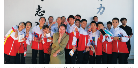
▲株洲外国语学校初一年级的同学们的合影