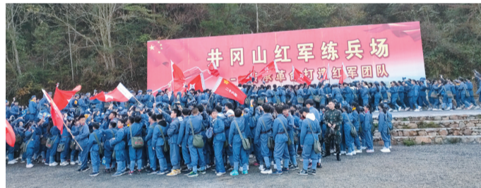
▲株洲市十九中的同学们情景再现红军长征

10月29日,株洲市十九中初二、初三年级,11月7日,株洲市外国语学校荷塘学校初二、初三年级的学生们分别参加了株洲穿越动力谷国际旅行社组织的“追寻红色足迹·传承革命精神”研学旅行实践活动,孩子们前往井冈山了解革命历史和红色文化。同学们攀登南山火炬广场体会“世上无难事,只要肯登攀”的豪迈精神,并举行开营仪式;在北山烈士陵园向革命英烈敬献花圈;参观井冈山革命博物馆亲身感受革命的峥嵘岁月。毛泽东故居、朱毛会师、黄洋界保卫战、八角楼的灯光……同学们仔细看,认真听,还不时地拿出研学手册做记录,孩子们的心灵得到了洗礼,他们将更加坚定自己的理想信念,履行时代赋予的使命。