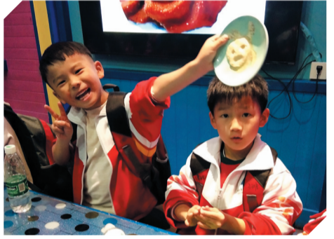
▲株洲外国语学校小学部的同学做的DIY小饼干