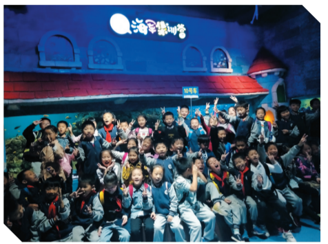
▲金山小学同学们快乐合影