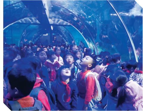
▲何家坳枫溪学校的同学们走过海底隧道