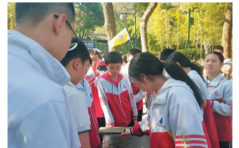
▲株洲外国语学校初三年级的同学们杭州研学