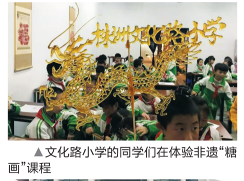
▲文化路小学同学们在体验非遗“糖画”课程

11月14日至17日,株洲市外国语学校荷塘学校初三年级的同学们前往杭州和绍兴,感受江南之美!走进西湖感受美景,探访安吉古镇古典建筑特色、参观兰亭寻访“曲水流觞”的历史典故,细品绍兴追忆鲁迅文学故事。根据研学目的地和同学们的年龄制作的研学手册;贴合同学们的兴趣点开展的研学讲解内容……细节设计充实着研学的每一个环节,也为此次研学的高质量提供了保证。