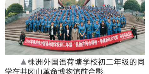
▲株洲外国语学校初二年级的同学在井冈山革命博物馆前合影