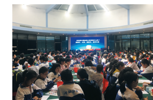
▲龙泉小学同学们在醴陵开展研学课堂

10月28日,龙泉小学组织学生赴醴陵瓷谷开展陶瓷文化研学实践活动。醴陵的制瓷历史悠久,瓷器更是世界闻名。同学们先后参观了陶瓷历史与科普馆、艺术馆,通过讲解员的讲解和现场参观,同学们充分了解了陶瓷文化的博大精深。在动手体验环节,专业的陶瓷老师向同学们展示了醴陵的精湛陶艺技术,并教给孩子们如何进行手绘陶瓷,同学们听得聚精会神,并亲与实践,一朵鲜花、一只小狗、一片大海……孩子们天马行空的想象力,个性十足的创意尽情得到了展现。