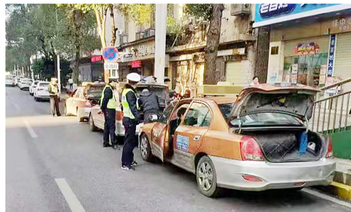
▲出租车违停等客,司机掀起尾厢盖躲避抓拍

本报讯(记者 刘玺 通讯员 陈楚杰)芦淞区车站路一带有大型商业区和火车站,车流人流密集。