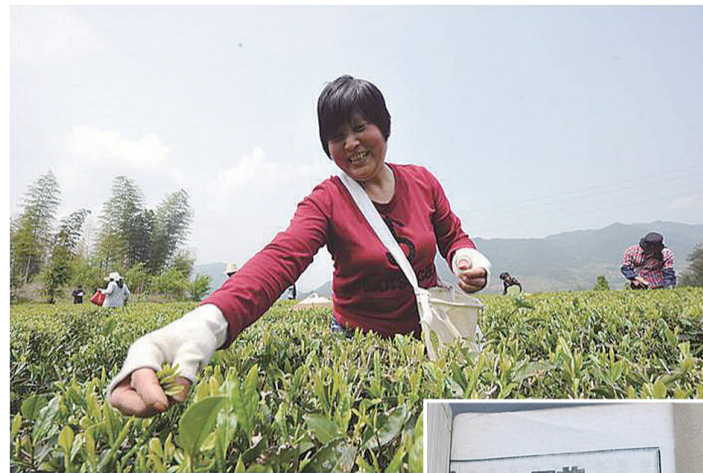
▲茶农采摘的茶叶经挑选、发酵等工序后,将制作成红茶