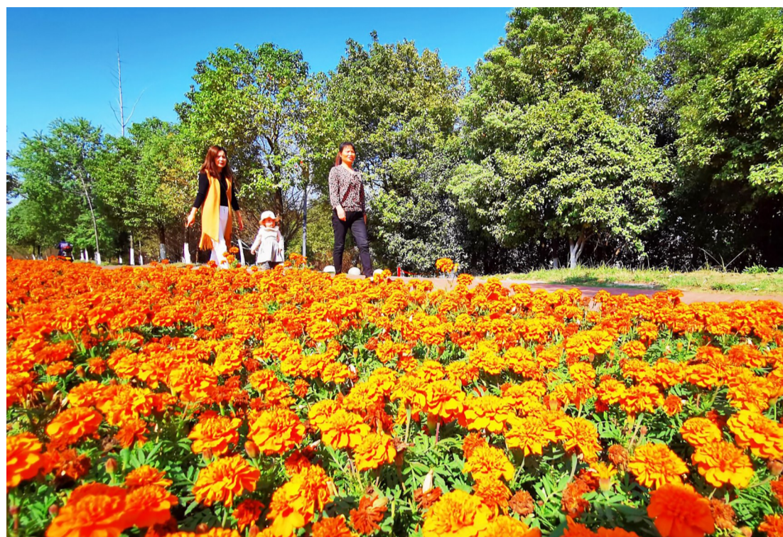
▲连日来,天气晴朗,市民在河西湘江风光带赏花,生活也如花一般,美丽多姿