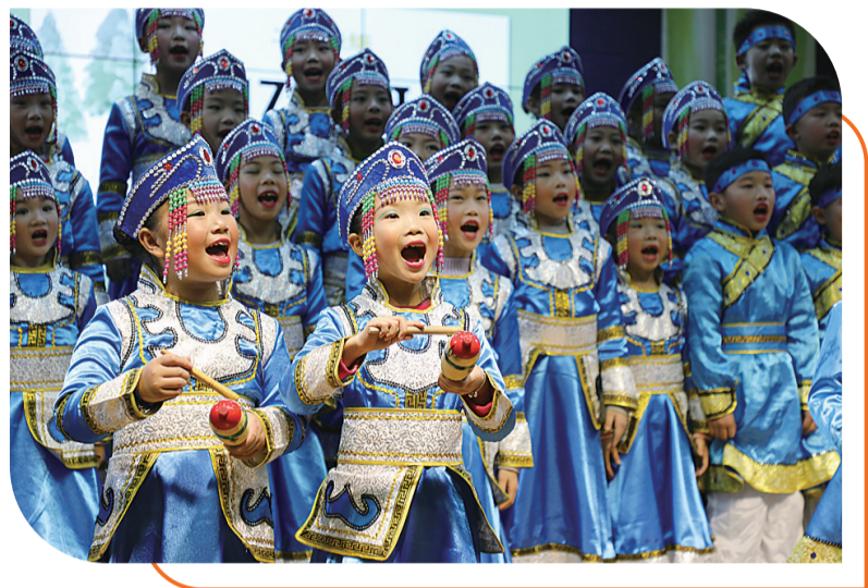
▲音乐节上,同学们齐声歌唱