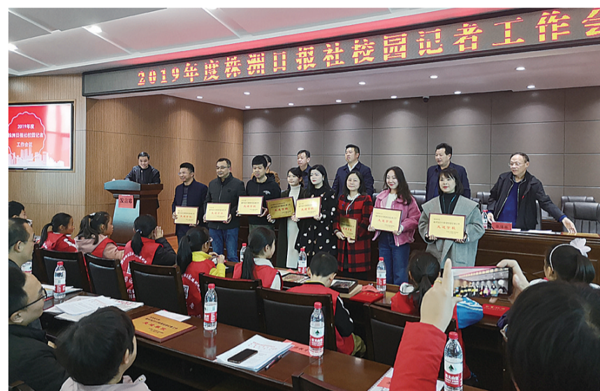
▲获奖先进学校合影