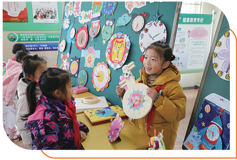
▲教师文化节,一年级学生展示自己制作的钟表