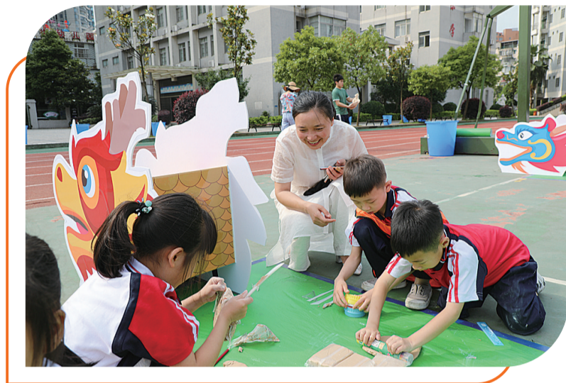
▲不一样的学科文化节,成就同学们不一样的精彩