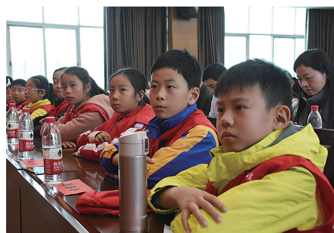
▲“十强”小记者认真聆听发言