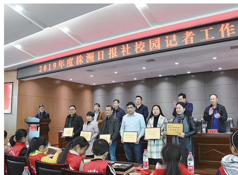
▲获奖先进单位合影