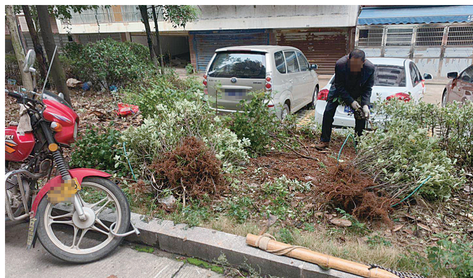
▲业主无视记者劝阻,执意要拔掉灌木