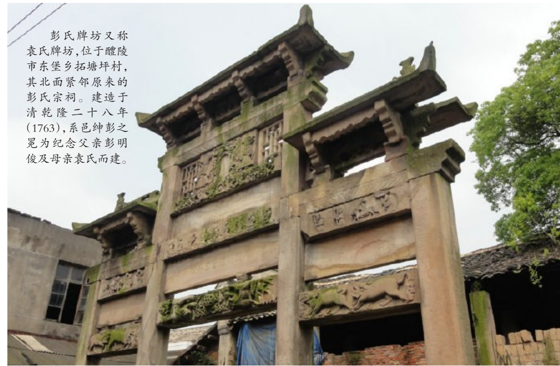
彭氏牌坊又称袁氏牌坊,位于醴陵市东堡乡拓塘坪村,其北面紧邻原来的彭氏宗祠。建造于清乾隆二十八年(1763),系邑绅彭俊之冕为纪念父亲彭明俊及母亲袁氏而建。