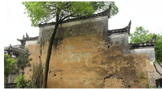
▲“彭氏宗祠”大部分已拆除