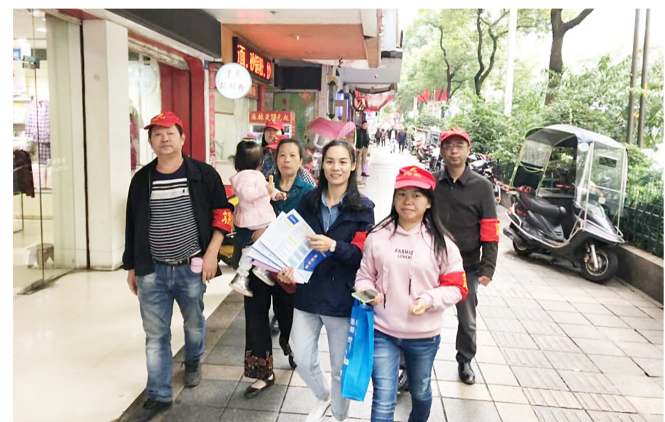
▲“初心课堂”党员志愿者上街宣传文明知识

本报讯(记者 戴凇 通讯员 宁翔)日前,芦淞区建宁街道党工委把“建宁党旗红”“初心课堂”搬进社区,走上大街小巷,以特殊的方式,让党员践行初心和使命。 上周末,“初心课堂”党员志愿者化身文明交通劝导员,为街头增添了一抹亮色。他们在辖区交通路口,引导市民遵守交通规则和社会公德。而在居民区,他们又成了调查员,围绕“基层党建”“网上群众路线”“无物业管理小区治理”“养老服务”等群众切身利