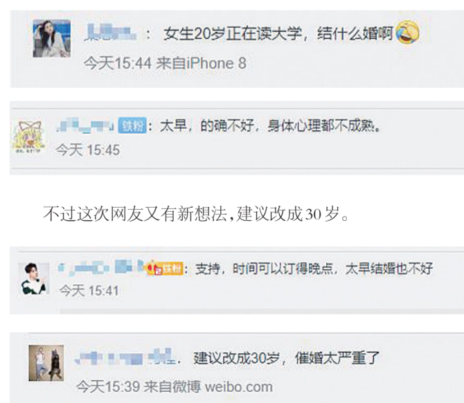
(据中新社·环球时报)