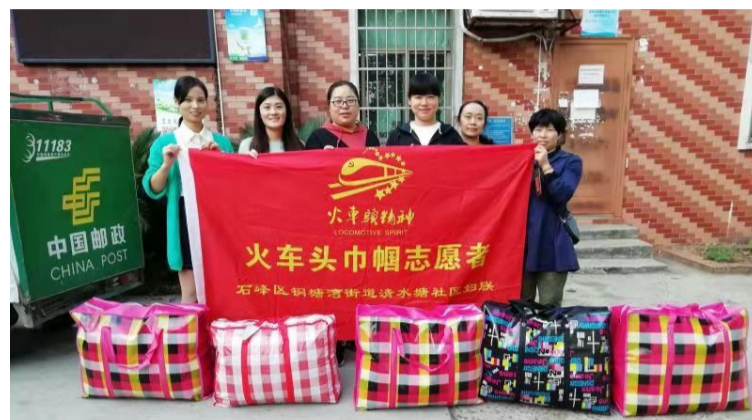
▲社区居民捐赠的冬衣和棉鞋打包寄出

本报讯(记者 李卉 通讯员 朱雁)“希望这份千里之外的关心和温暖,让你们度过一个温暖的冬天,在你们心中播撒下阳光的种子……”近日,铜塘湾街道清水塘社区第五网格发起了一场爱心捐赠活动。居民们捐出的100多件(双)冬衣和棉鞋已寄往云南省丽江市玉龙县石鼓镇仁义完小,部分居民还在冬衣中留下亲笔书信,希望以此鼓励孩子健康成长。