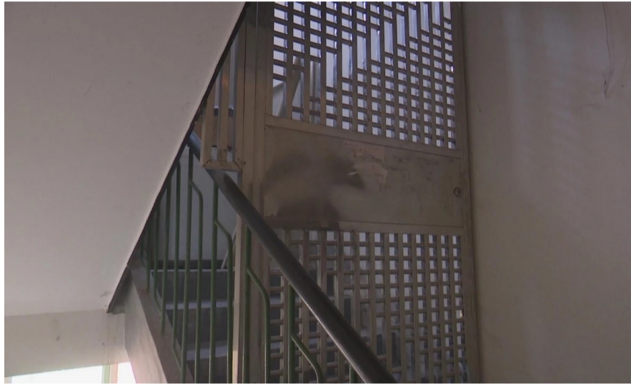
▲9楼邻居在楼道装的不锈钢门