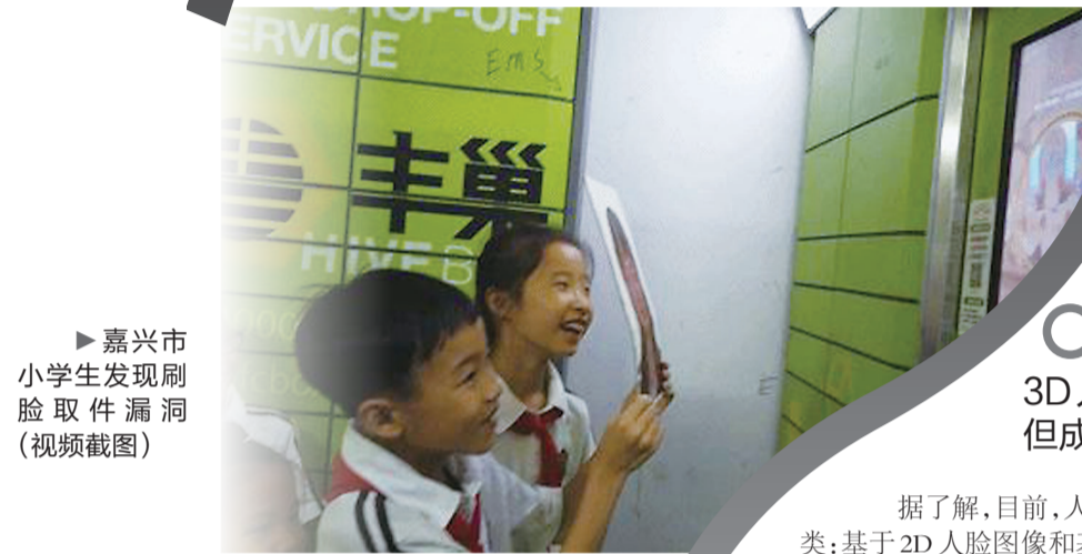
►嘉兴市小学生发现刷脸取件漏洞(视频截图)

涉事快递柜企业、深圳市丰巢科技有限公司(以下简称“丰巢”)向记者回应,收到部分用户反馈后,已下线智能快递柜“刷脸取件”功能。然而,在“刷脸取件”成为很多智能快递柜“标配”的当下,“刷脸技术”靠谱吗?