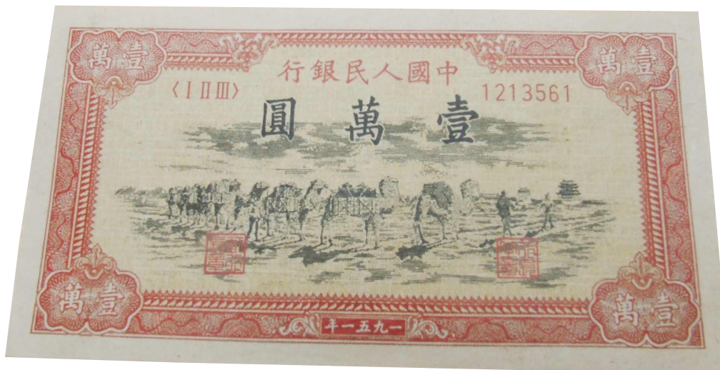
▲ 10000元面额的第一套人民币

中国人民银行已于8月30日发行2019年版第五套人民币。新版人民币包含:50元、20元、10元、1元纸币和1元、5角、1角硬币。中国人民银行介绍,新版纸币提高了票面色彩鲜艳度,优化了票面结构层次与效果,整体防伪性能也提高了。