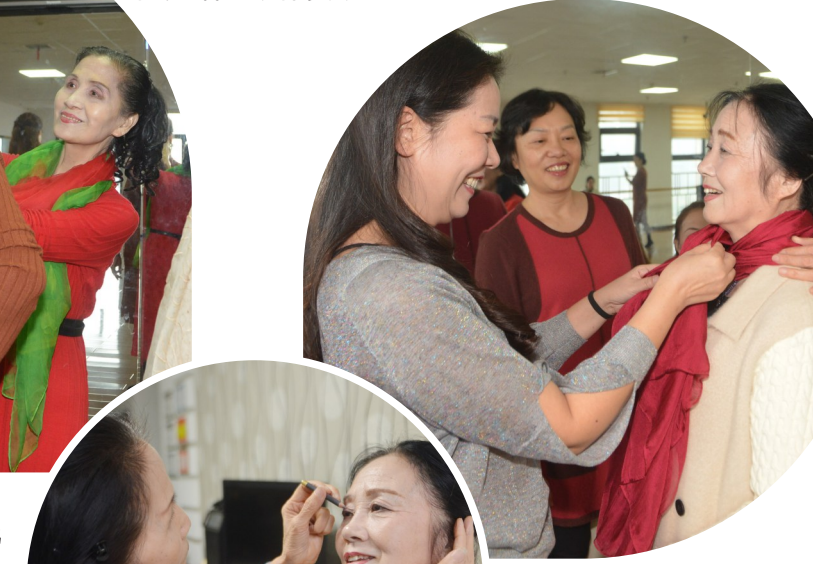
队员们在一起互相帮忙搭配服饰