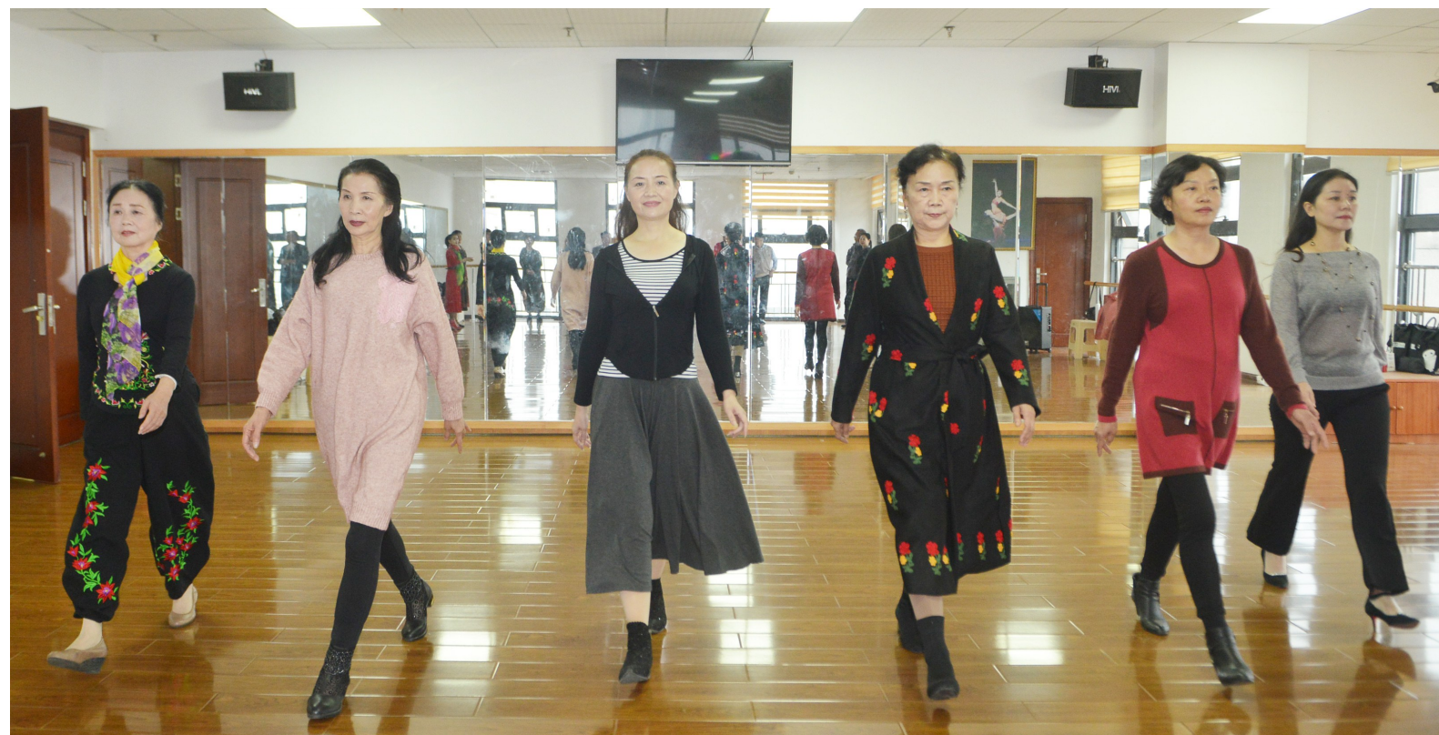
▲ 这些已经年过60或70岁的阿姨们迈着整齐模特步法,走出了青春的活力