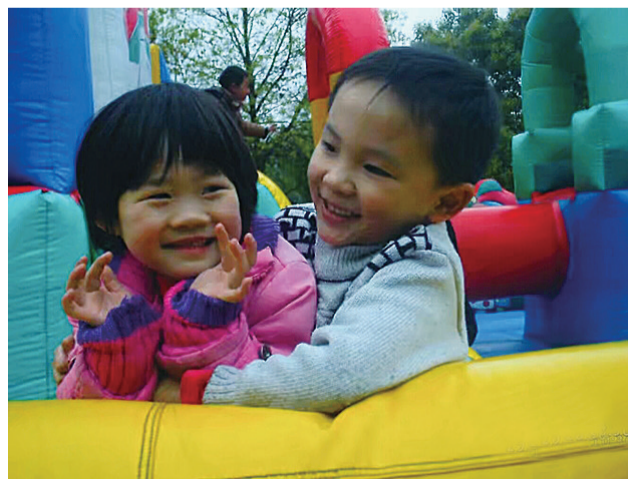
2011年4月4日,周末,带着孩子到文化园玩。在淘气堡里孩子们玩得多投入啊!八年过去了,当年的小美女变大美女了吧! 投稿:a岁岁平安