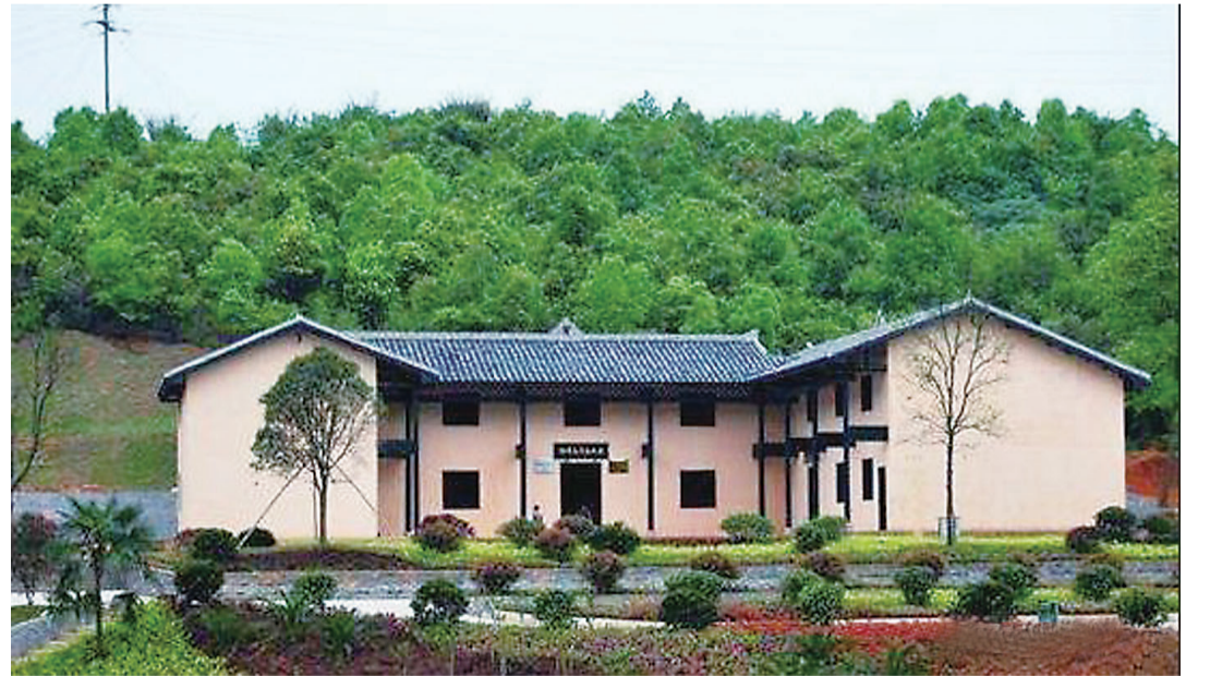
▲杨得志将军故居