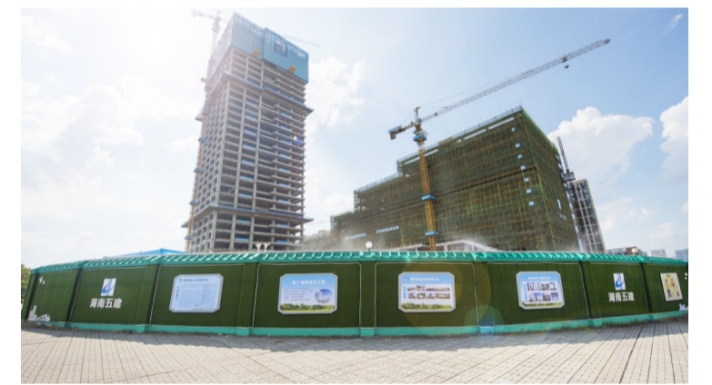
▲工地围挡覆绿,喷洒水雾降尘

建筑工地扬尘,是我市PM2.5颗粒物的主要来源之一。近期,天元区在全省率先推出了不少妙招,想方设法让辖区的项目工地上穿上“绿装”。