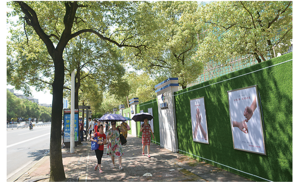
▲天元区一处项目工地外墙换“绿装”

建筑工地扬尘,是我市PM2.5颗粒物的主要来源之一。近期,天元区在全省率先推出了不少妙招,想方设法让辖区的项目工地上穿上“绿装”。