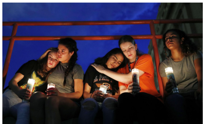
▲8月3日,在美国得克萨斯州西部埃尔帕索市,民众参加悼念枪击案遇难者的守夜活动

另据当地媒体报道,凶手作案前在网上张贴了一份长达4页的所谓“宣言书”,其中将移民称为“入侵者”,指责移民进入美国的目的是“种族替代”和“种族混杂”。