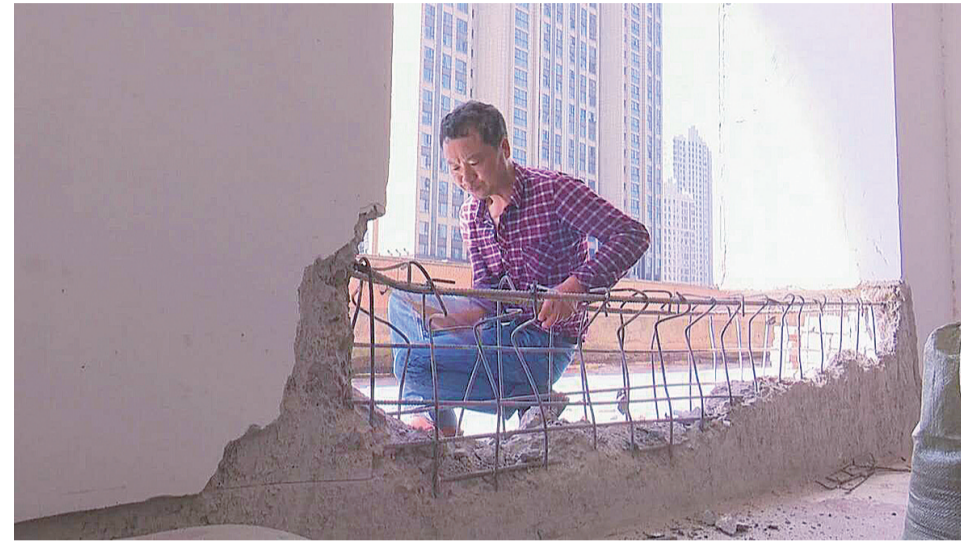
▲房屋承重房梁被敲掉,钢筋裸露在外