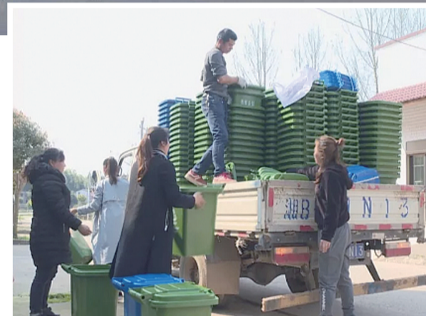
▲白关镇给每家每户配置垃圾桶,实现垃圾分类 记者李卉撰

同时,白关镇妇联积极组织妇女群众参与村庄清洁美化行动,推进道路庭院绿化。一车车垃圾被清运,一处处违章建筑被拆除,取而代之的是2万多株苗木铺展开来,将居住环境装点得绿意盎然。