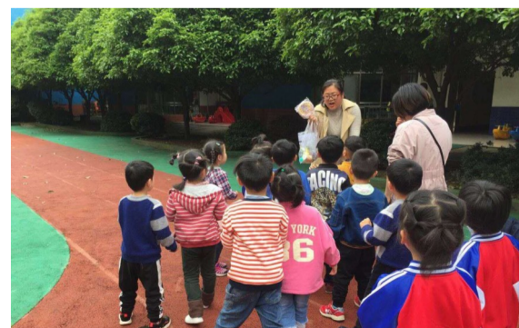
▲家长扮演的“坏人”拿出糖果,孩子们纷纷被吸引