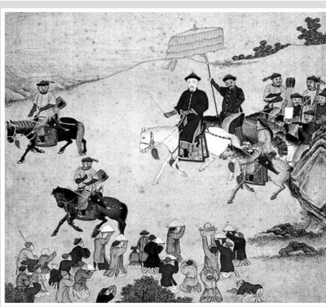
▲《乾隆南巡图卷》局部