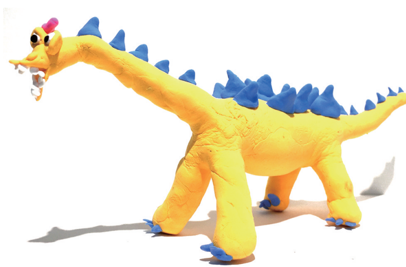
银海学校1709班 胡雅茹 证号: 0232131 指导老师: 陈建红