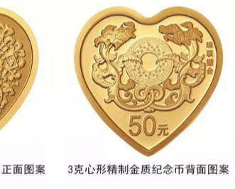
3克心形精制金质纪念币正面图案 3克心形精制金质纪念币背面图案

据央行官网消息,中国人民银行4月18日发行2019吉祥文化金银纪念币一套。该套金银纪念币共7枚。上热搜的是本次最特别的两枚心形纪念币。点进去一看,确实少女心爆棚啊。难怪有网友说:“连硬币都是爱情的形状。”