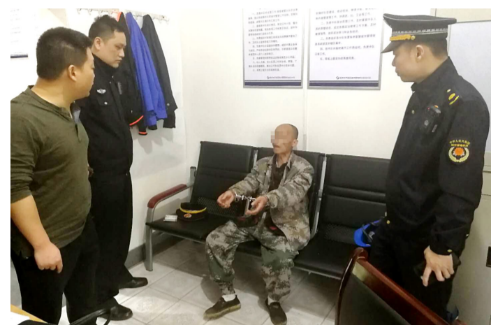
▲芦淞区法院办案人员对刘某某采取强制传唤

本报讯(记者 伍婧雯 通讯员 城关 罗丽芳)违规在湘江风光带上养马、做生意,收到城管部门开出的行政处罚单,刘某某为那仅仅是“一纸文书”,拒不理睬。直到昨日,芦淞区法院要对其采取强制执行措施,他才终于承认错误。据悉,这也是《株洲市城市综合管理条例》(以下简称《条例》)出台以来,我市首起城管部门申请法院强制执行案件。