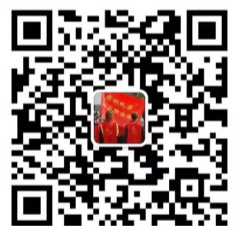
“株洲晚报志愿者联合会”二维码

毅行当晚的大型民谣音乐晚会是面对所有毅行者开放的,除了在当地宿营的常规组毅行者以外,亲子体验组和挑战组的毅行者可以自行决定是否观看。其他组毅行者需要自行解决来回的交通问题,请各位毅行者注意安全。