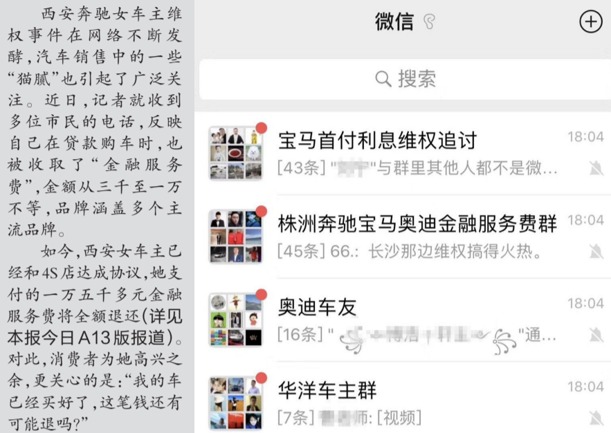
▲株洲部分车主组建了微信群,交流关于“金融服务费”的信息