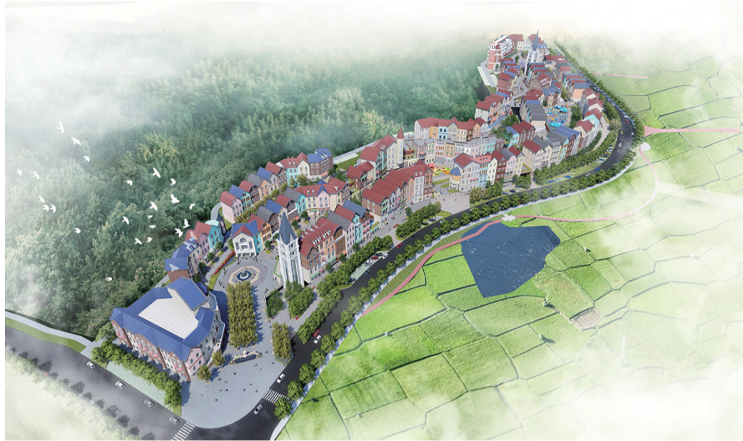
▲奥特莱斯童话小镇效果图

渌水二桥:渌水二桥计划2019年7月底建成通车。无论是人口支撑,还是产业定位,还是全面融城,渌口区已经有了很好的基础,做足了充分的准备,她正在正确的道路上奋力前行,不久,渌口区将与其它四个区平分秋色!