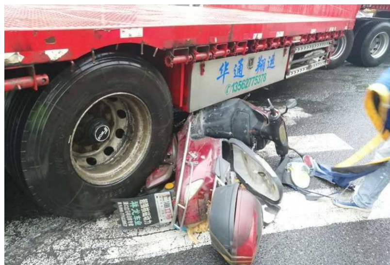
▲电动车被货车右后轮压报废