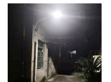
▲ 新安装的路灯亮了