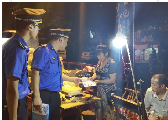
▲城管执法人员向街边摊贩宣讲《株洲市城市综合管理条例》,劝导规范经营 (资料图)