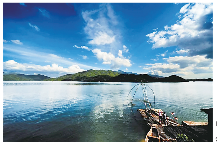
▲ 酒仙湖景区(资料图)

本报讯(记者 何春林) 记者昨日从省旅游发展委员会官网上获悉,我省新增4家国家4A级旅游景区。其中,我市的酒仙湖景区名列其中。 记者了解到,此次评选是由省旅游景区质量等级评定委员会组织的,新增的4家4A级旅游景区分别是:株洲市酒仙湖景区、岳阳市天岳幕阜山