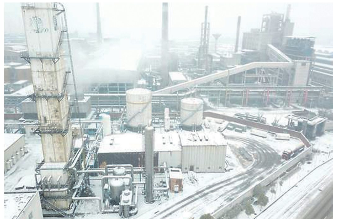
▲ 去年12月30日,株冶在清水塘地区最后一座冶炼炉熄火

本报讯(记者 戴凇) 株洲再次“亮相”央媒。昨日出版的《人民日报》2版,发表了《长江奔涌新动能——写在推动长江经济带发展座谈会召开三周年之际》的报道,讲述了株洲清水塘搬迁的故事。 报道称:“枕靠湘江的清水塘,是我国‘一五’‘二五’期间重点建设的工业基地,承载着共和国工业的荣光,但是‘高消耗、高排放、高污染’的粗放式发展积累了严重的污染,成为入洞庭、汇长江的湘江之殇。清水塘断然转身的背后,凸显地方党委政府刮骨疗伤的决心。”“株洲市虽承受‘史上最大力度’去落后产能的阵痛,但锚定轨道交通、通用航空、新能源汽车三大动力创新产业,全力打造‘中国动力谷’。” 2018年12月30日,株冶冶炼集团在我市清水