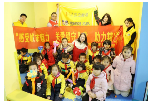
▲5日,孩子们在机器人活动中心合影

500元助学金。 当天上午,在株洲市杜乐伯特机器人活动中心,老师们向孩子们介绍了科普知识,并展示了各种功能的机器人。这些机器人有的能够进行投篮、有的会自动识别和躲避墙壁、有的能够翻越各种障碍……各种神奇的机器人让来自农村的孩子们不断发出惊叹。随后,在老师的带领下,孩子们走进教室,首次亲手制作了属于自己的机器人,感受到了科技带来的魅力。 当日,孩子们还参观了市规划展览馆,并体验了陶艺制作、花艺制作等。 共青团芦淞区委工作人员介绍,此次活动是共青团芦淞区委关爱留守儿童、助力精准扶贫系列活动之一,旨在向孩子们展示城市风貌,激励他们努力学习,做时代的追梦人。