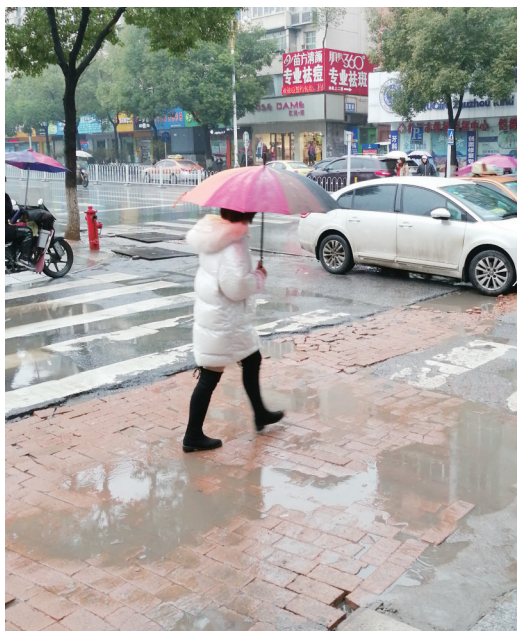
▲新华西路部分路段铺的是红砖

对于本案,法院认为,双方保险合同中并未排除在4S店修车,所以只要4S店价格合理,就必须予以理赔。同时,双方签订的合同是格式合同,根据合同法第41条规定,应当作出有利于提供格式合同条款方上诉人的解释,所以应当按照4S店的标准核定。而且,拖车费用合理,保险公司也应予以理赔。