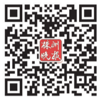
▲扫码参与“年货10元捐”

在这里,我们再解说一下该系统的流程:第一步,关注株洲晚报微信公众号;第二步,点开该公众号右下角“年货10元捐”;第三步,再点击“2019 大爱株洲·为特困 群众送年货”图标;第四步,根据各人的捐款意愿,点击10元、50元、100元、500元右侧的红色字“去支持”,弹开后,再点击“微信支付”,按微信支付流程进行支付,即可完成爱心捐赠。