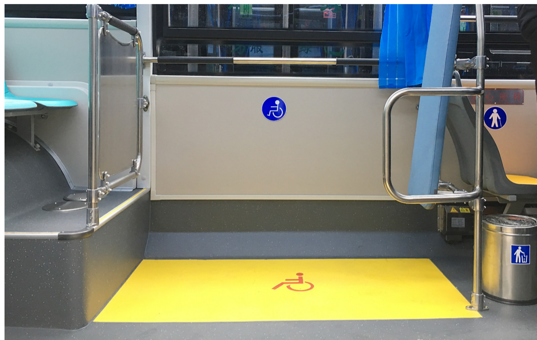
▲车厢中部设有轮椅停放区域

本报讯(记者 戴凇 通讯员 殷滋)昨日,我市举行首批低地板电动公交车投放仪式。按计划,这些公交车将于近期陆续上路。该车不仅台阶更低,还设置了折叠坡道,使用轮椅出行者乘坐起来更方便。