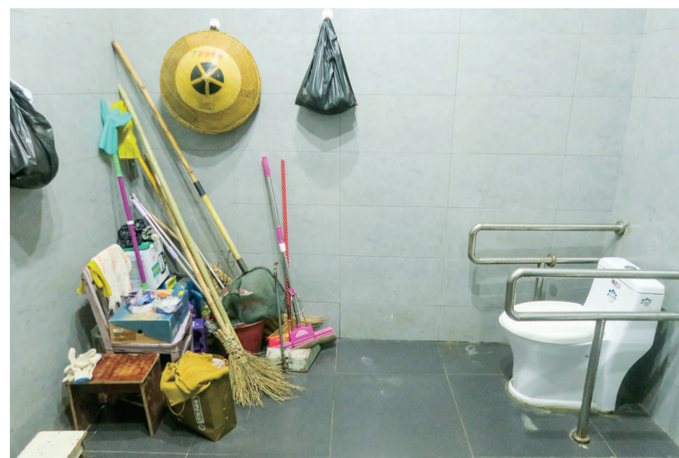
▲在河西风光带钢琴广场,残疾人厕所内堆积了清扫工具

近日,晏女士拨打晚报热线28829110称:我住在芦淞区,虽然身体不太方便,但我很喜欢去湘江风光带散心,可是好几次,我需要方便时发现风光带公共厕所的残疾人专用间不能使用。这特别尴尬,希望相关部门能够重视。