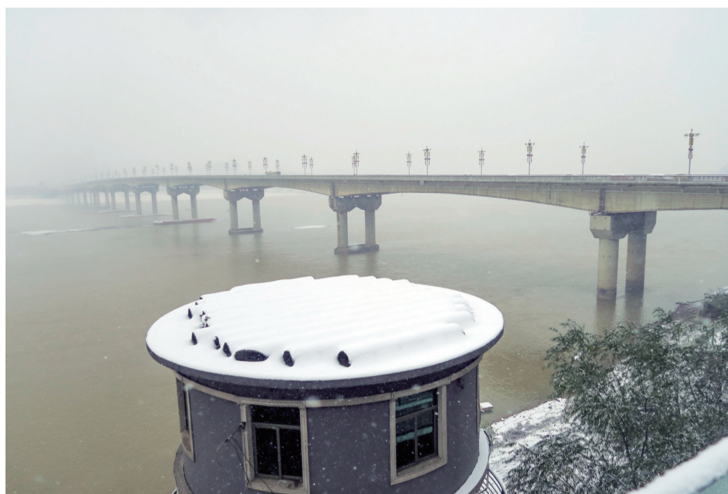
▲昨天,气温依旧很低。河东风光带上,还堆着厚厚的积雪