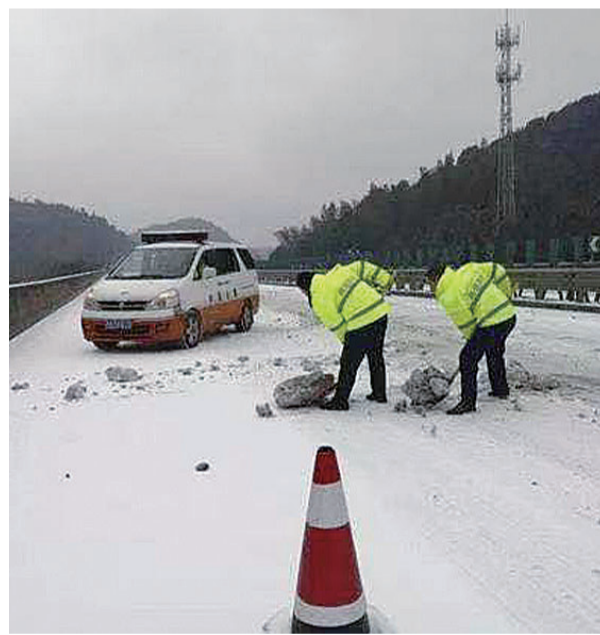
▲高速路政人员正在清理平汝高速上的路面障碍物

昨日凌晨,交警部门对桥梁、匝道、迎风路面等重点实行通宵值守,发现道路结冰现象立即采取管制措施,并配合市政部门撒盐除冰;安排民警在高速公路入口值守,与高速交警紧密配合,及时疏导分流车辆,未发生车辆滞留;在危险路段设置提示标志200余块,通过新闻媒体及时发布路况和事故信息,发送安全提醒短信40万余条。