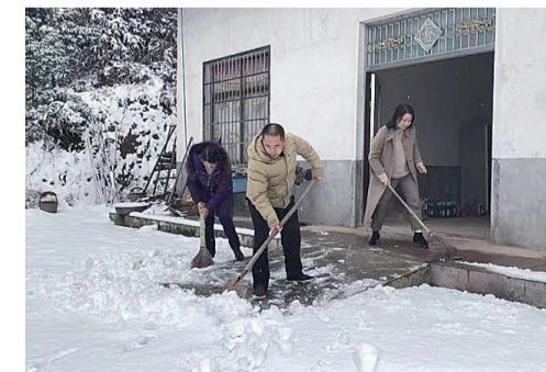
▲石峰区农村工作局的工作人员帮助五保老人清理出一条出行通道