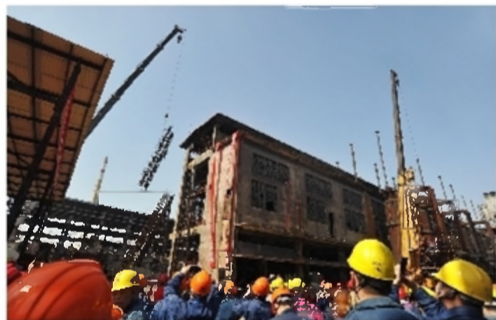
清水塘株洲冶炼厂新址

改革开放40年来,株洲工业一直占据着GDP总量的“大头”,贡献率最大的时期达到66.5%。1978年,全市工业增加值仅有6.14亿元,至2017年达到1050.6亿元,增长170倍。2017年全市规模以上工业企业固定资产投资达到2102亿元,为1978年的170.8倍,全市有规模以上(年营业收入过2000万元)企业1647家,其中产值过100亿元的企业有3家,产值过10亿元的企业17家,产值过亿元的企业673家。