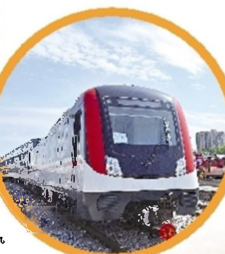
中车株机 地铁产品

改革是触动既得利益者的蛋糕,当然会有矛盾,但不改革就没有出路。改革需要决心和力度,要正确处理改革发展与稳定的关系,只要我们思想开放,守住底线,实事求是、锐意进取,还能通过改革取得更大的成就。