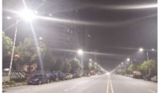
亮如白昼的炎陵县城街道。

株洲日报讯 “哟，又白又亮，连街道都变得敞亮了！”12月13日傍晚，炎陵县城华灯初上，大街小巷瞬间亮如白昼，刚完成节能灯升级改造的街灯闪亮了市民们的双眼。 过去，炎陵县城街道路灯均采用传统的钠灯，耗电大且亮度不够。为了改变这种现象，炎陵县决定对县城路灯升级改造，并将城市照明路灯节能灯升级改造列为该县2018年的重点项目和“民生100”重点工程。 近年来，该县城管局精心安排，狠抓落实，组织人员进行路灯数量