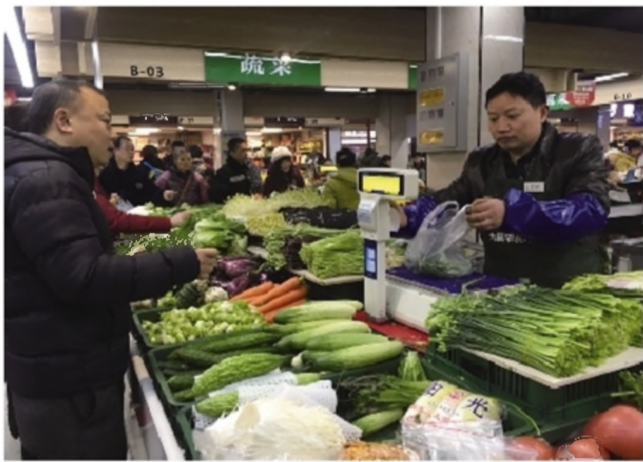
九园农贸市场里,市民获得更好购物体验。

在九园农贸市场,LED显示屏实时显示当天食品安全检测信息,据介绍,该市场建立了食品安全快检中心,免费开展检测服务。