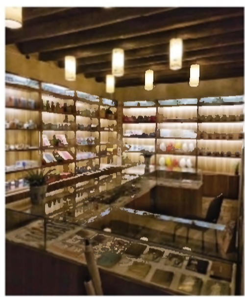
秋瑾故居纪念馆商店开业

该区渣土大队本着不徇一己私利、不徇一户的原则,始终保持对“两违”建筑的高压态势,坚持违建“零容忍”“零补偿”原则,持续落实巡查制度,无人机巡航作业不停歇,坚决遏制城区规划区内的“两违”乱象。特别针对违建户,执法人员多次上门,耐心细致地做好当事人思想工作,动员其自行拆除,减少自身损失。