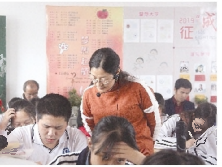
系列创新德育教育活动,让市十三中校园充满活力。市十三中充满活力的新课堂。