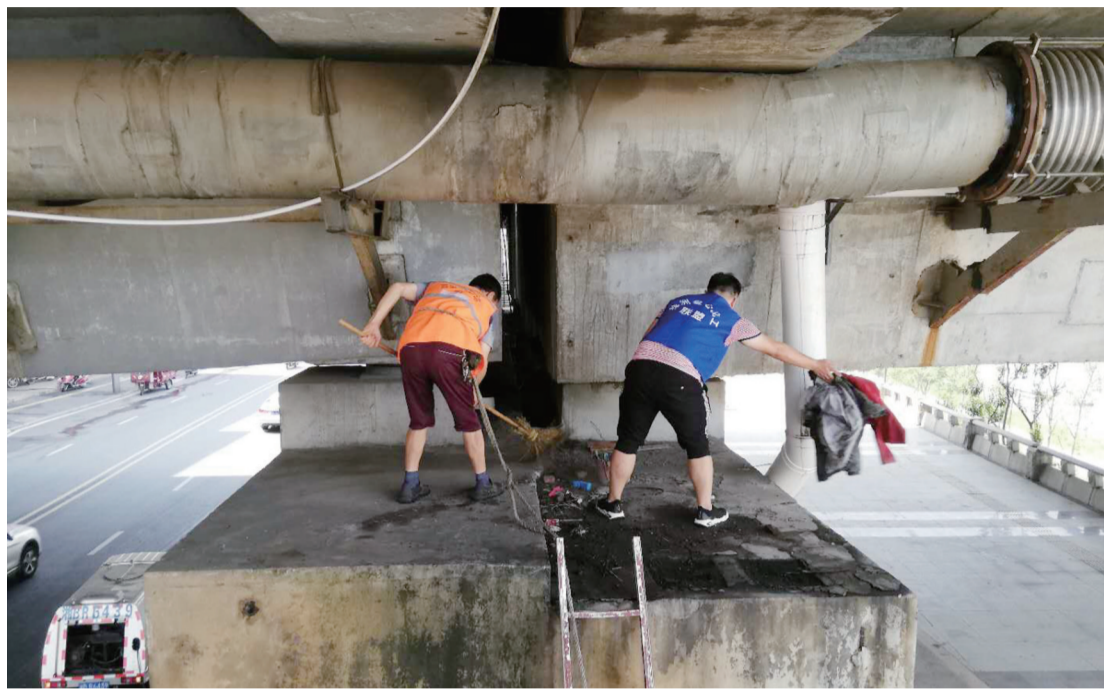
▲芦淞城管部门组织环卫工清理天元大桥桥墩上的垃圾

本报讯(记者 伍靖雯 通讯员 周洲)精细化的城市管理,意味着将管理的触手延伸至细枝末节。顺着这个思路,昨天起,芦淞区城管局开启环卫“微行动”,改造小环境,转变大市容。