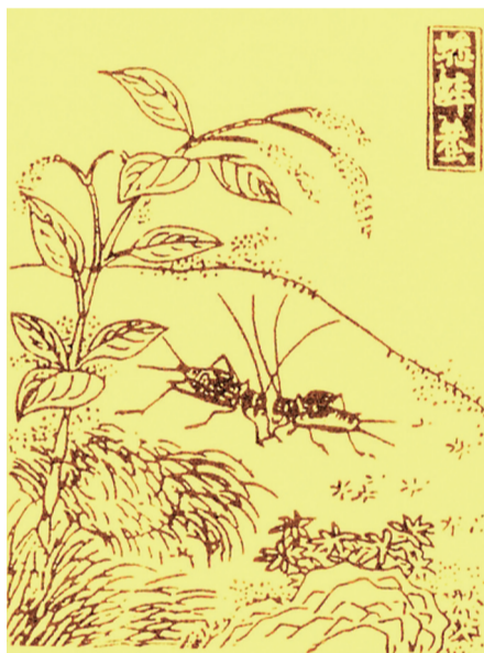
▲明代王圻《三才图会》中描写的鸣虫