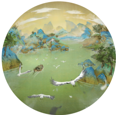
▲通过数字3D技术“复活”的《千里江山图》片段

本报讯(记者 何春林 通讯员 黄昆)如果看过央视的《国家宝藏》,你一定记得那幅《千里江山图》——接近12米长的画卷徐徐展开,烟波浩渺的千里江山跃然纸上,惊艳四座。今天起,市民可以在家门口体验这幅传世名画的独特魅力了,并且实现“人在画中游”。