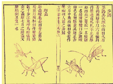
▲古本《尔雅》插图中的蟋蟀